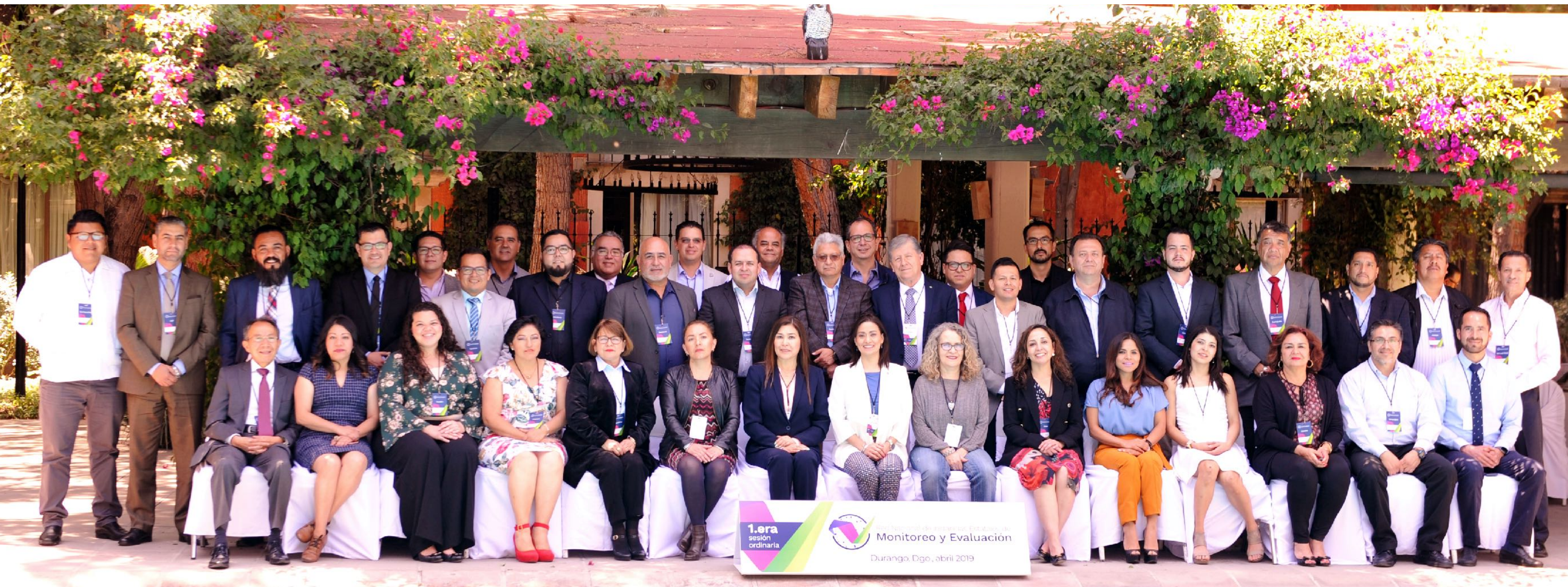
Durango, Durango - 2019