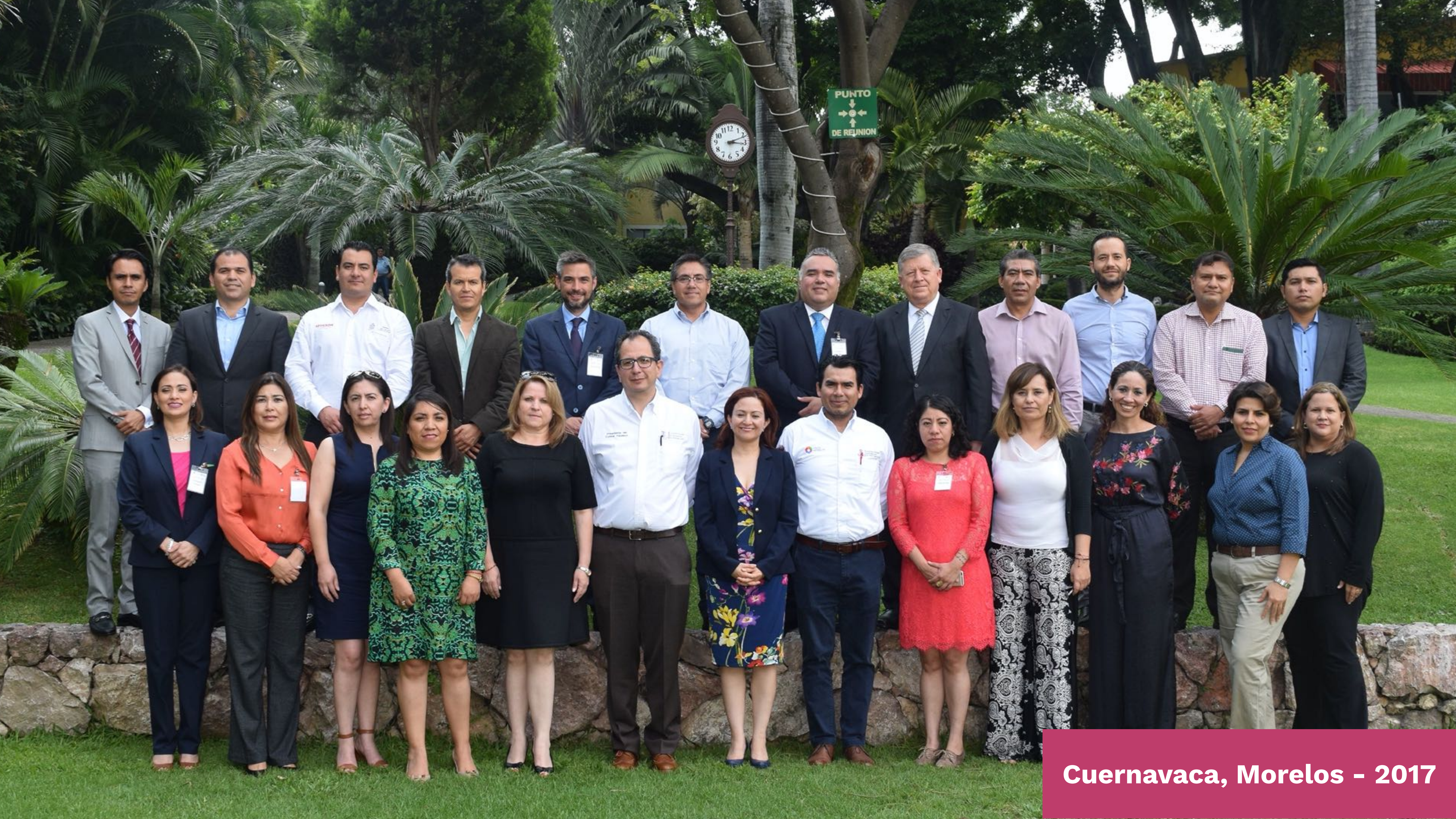
Cuernavaca, Morelos - 2017