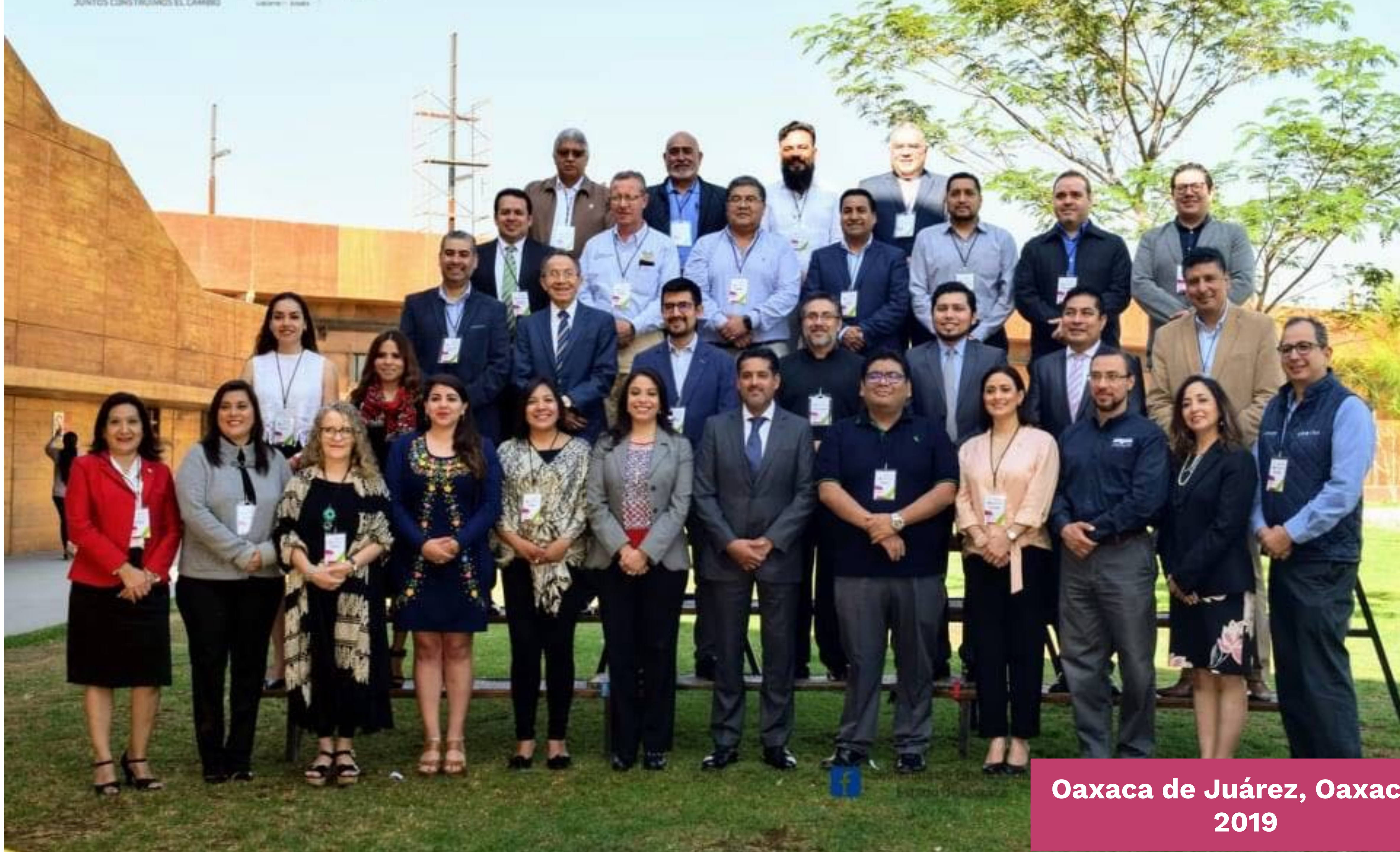
Oaxaca de Juárez, Oaxaca - 2019